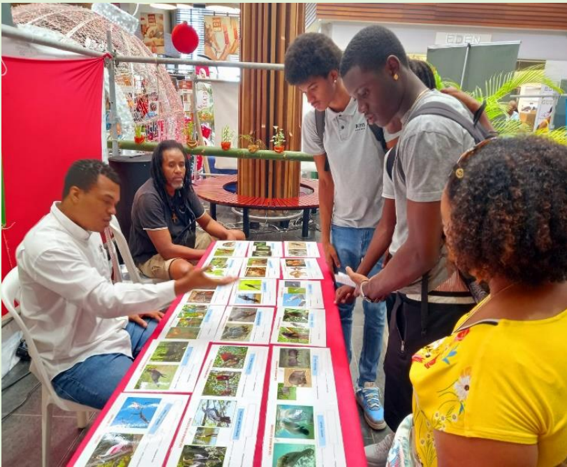
Connaissance des animaux de Guyane, stand tenu par la CTG